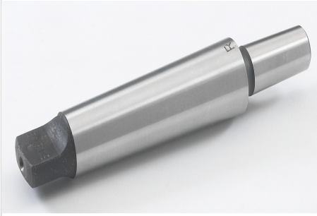
QUEUE DE MANDRIN CM3 - B18